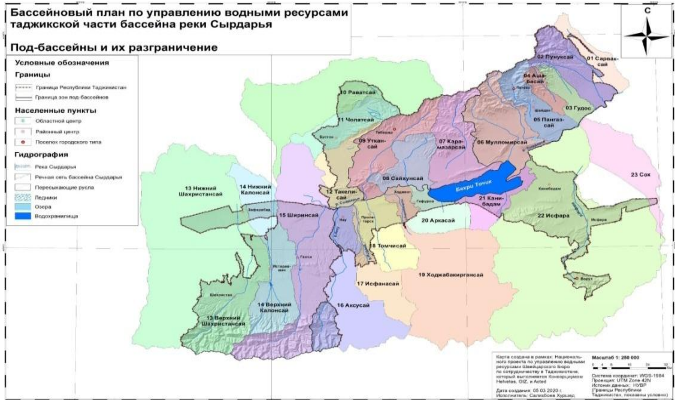
Карта 3 Под-бассейны и их разграничение

Таджикская Сырдарьинская бассейновая зона состоит из 23 суб-бассейнов, которые сгруппированы в шесть суб-бассейновых зон.