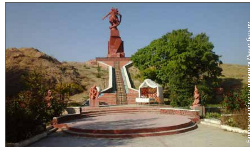
Баткенская область, памятник Манас батыру

Затем ДВР Баткенской области были приобретены строительные материалы для завершения строительных работ, в том числе восстановление ключевых гидропостов.