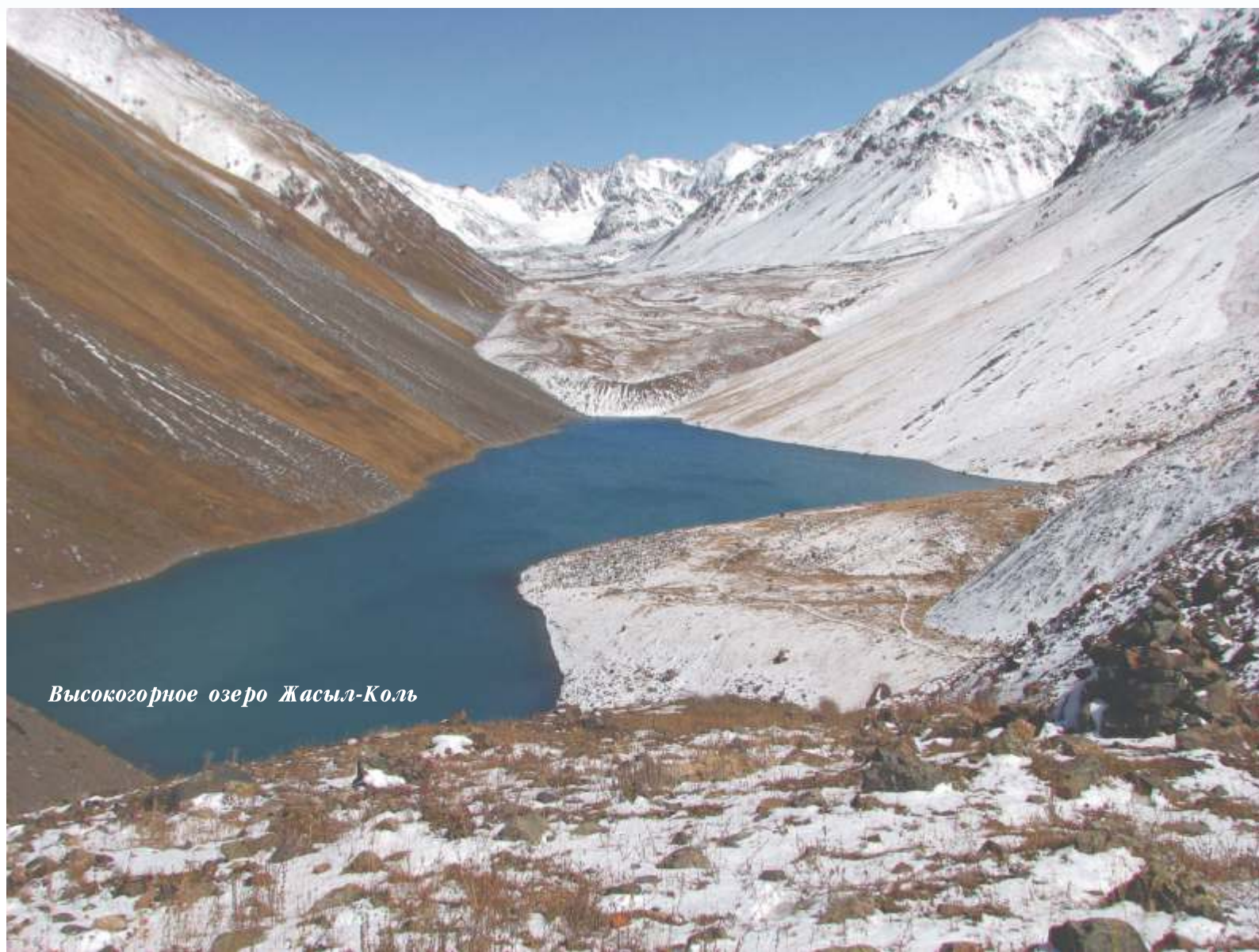
Высокогорное озеро Жасыл-Коль

Диагностический доклад и план развития сотрудничества